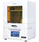
SmaPri Sonic 4KLL

収益性が低い作業を3Dプリンター・ミリングで実施すれば、歯科技工士はより付加価値の高い作業に集中でき、だれでも同じ品質の修復物が作製できます。