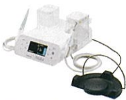
メルサージュエピック2in1