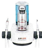
エアフロープロフィラキシスマスター

歯や補綴物への侵襲を最小限に優しくクリーニングすることができ、患者快適度が高く効率的に短時間でメンテナンスすることができます。