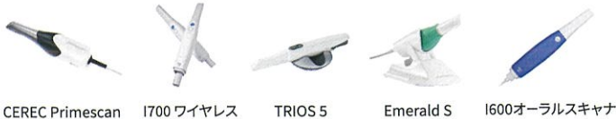
CEREC Primescan I700 ワイヤレス TRIOS 5 Emerald S I600 オーラルスキャナ